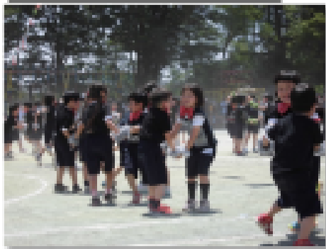
児童集会(代表委員)